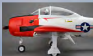
Elektrisches Einziehfahrwerk / Electric retractable landing gear