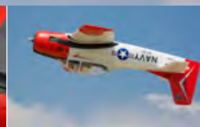
AS3X-Technologie (nur BNF Basic) / AS3X technology (BNF Basic only)